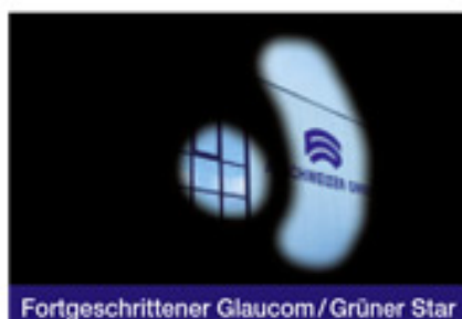
Fortgeschrittener Glaucom/Grüner Star