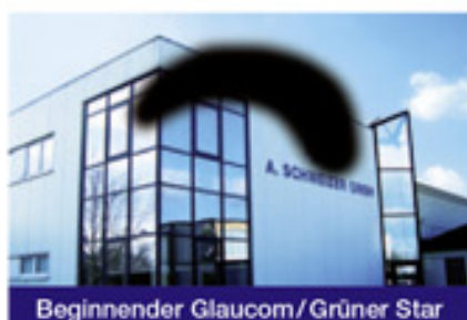
Beginnender Glaucom/Grüner Star